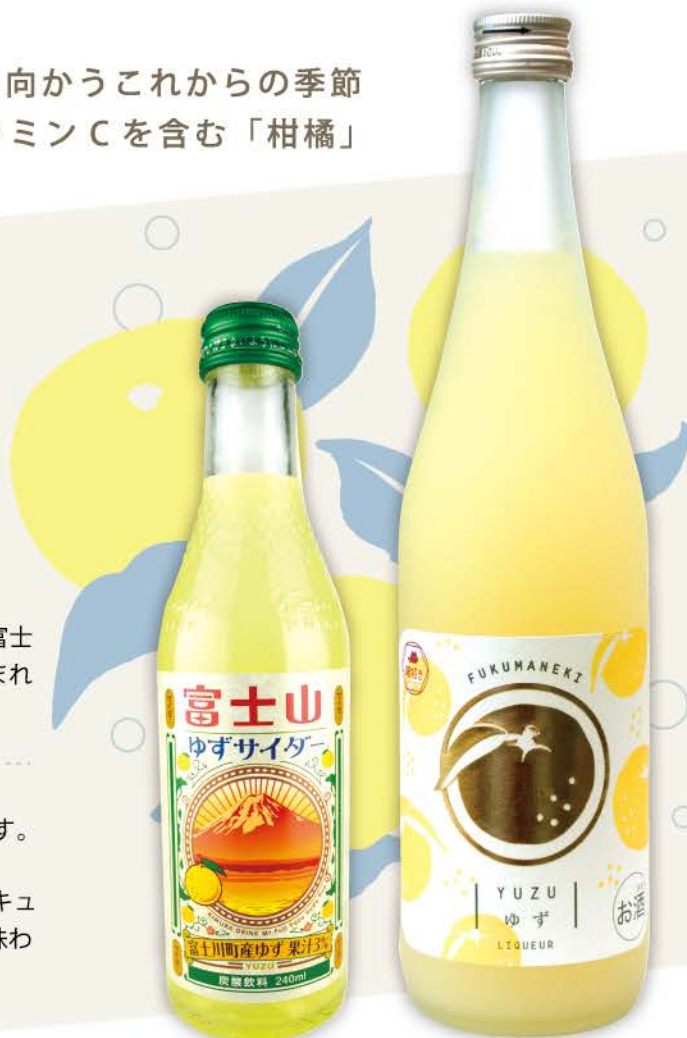
富士山ゆずサイダー 240ml ピン

国産の香り高いゆず果汁を使用した静岡生まれの本格和リキュール。爽やかな酸味と香り、甘さ控えめのスッキリとした味わいをお楽しみいただけます。