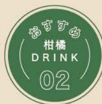
静岡みかんコーラ 240ml ピン