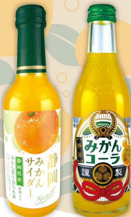
静岡みかんサイダー 240ml ピン