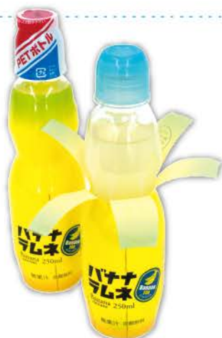
バナナラムネ / 250ml PET

バナナ風味の「バナナラムネ」で、家にながら南国バカンス気分。なんと本物のバナナの皮を剥くようにラベルがむけちゃいます！お子様と一緒に楽しみながらリサイクル。