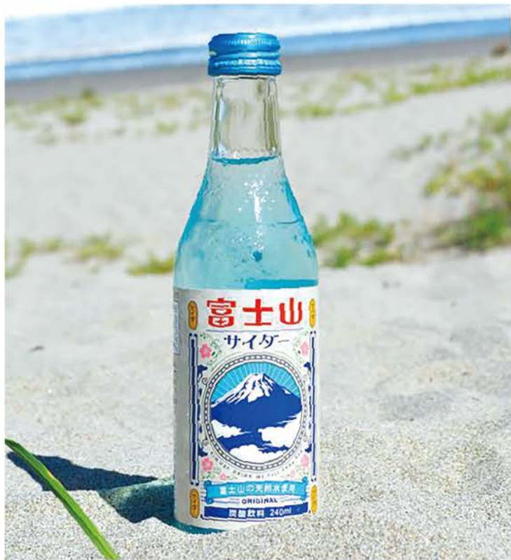
富士山サイダー / 240ml ビン

青く清々しい富士山をイメージした「富士山サイダー」。甘さ控えめでスッキリ爽やかな飲み心地です。鮮やかな青色はもちろん、ビンも富士山をイメージしたオリジナルビンを使用。さらにビンのどこかに隠れ富士も。